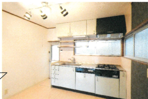
(システムキッチン&勝手口)